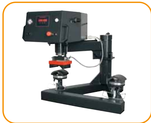
Abb. 5 · Kappenset