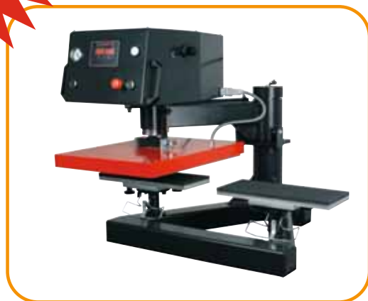
Abb. 2 · Ärmel- oder Hosen-Druckplatten · quer

JETZT NEU! Austausch-Druck- platten 'Girly' T- Shirts + Schirme