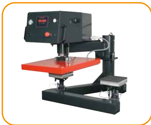
Abb. 3 · Brusttaschen-Druckplatten