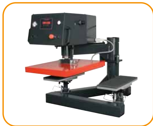
Abb. 4 · Ärmel- oder Hosen-Druckplatten · längs